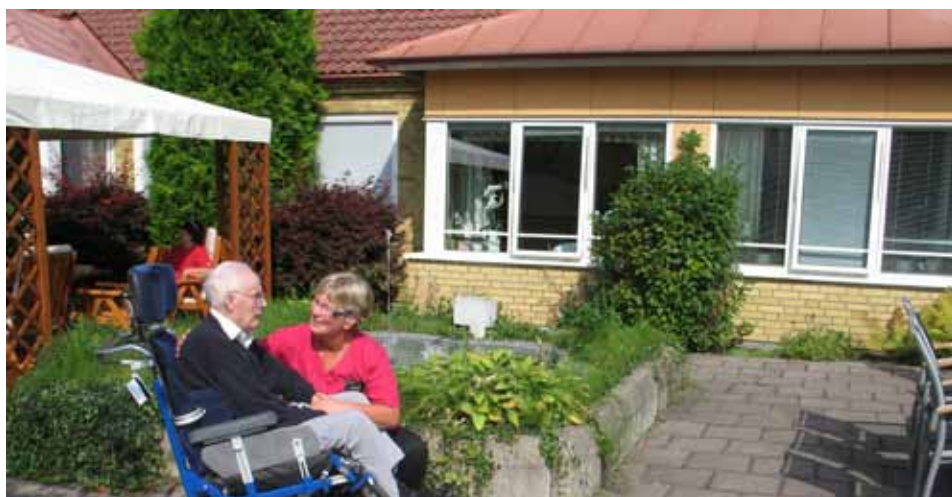
Personal och boende på äldreboendet i Gnosjö som just nu byggs om till Sveriges bästa demensboende.

Med hjälp av teknik från företaget CombiQ ska man frångå det traditionella sättet att trygga tillvaron för dementa, det vill säga att ha låsta