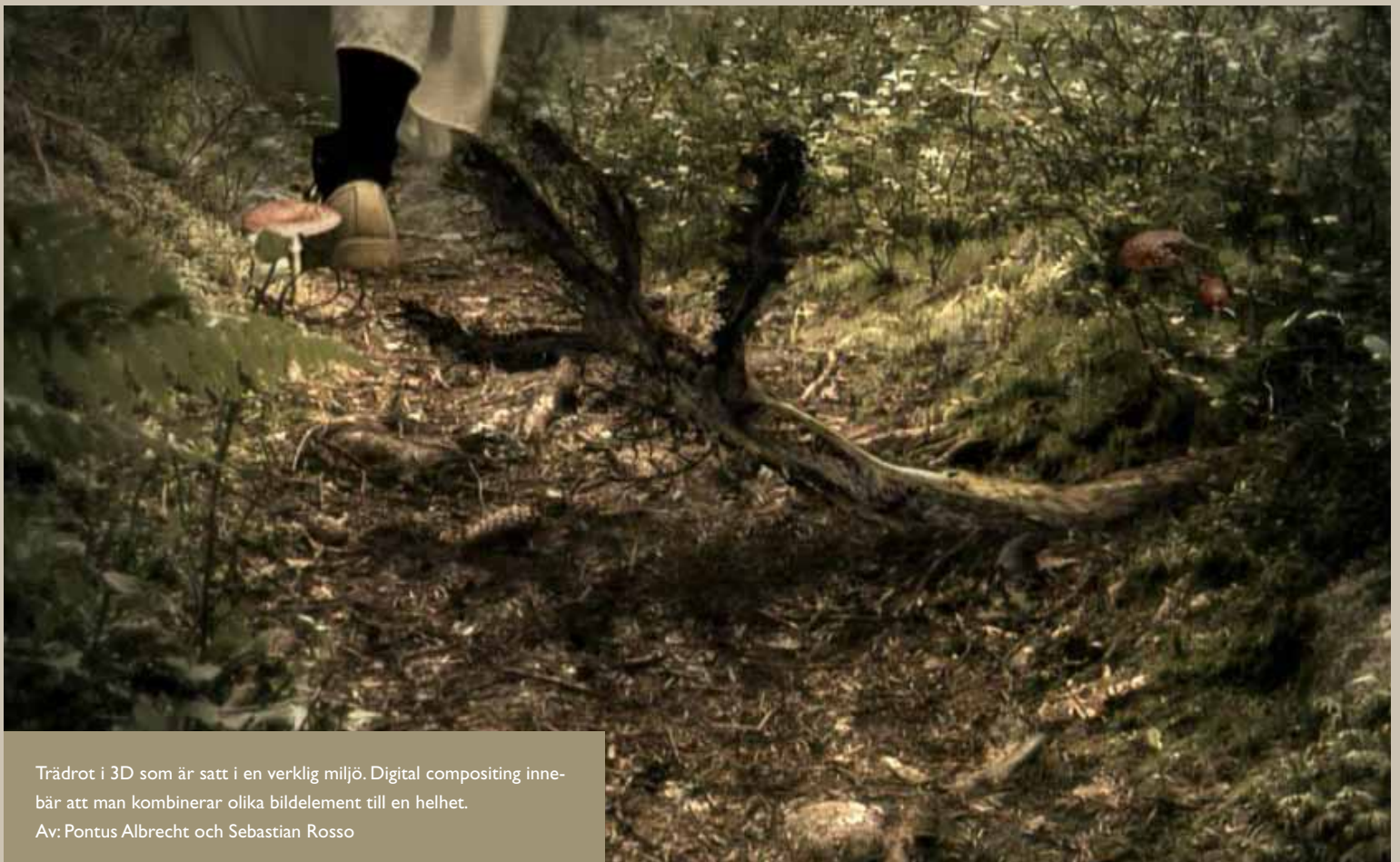
Trädrot i 3D som är satt i en verklig miljö. Digital compositing innebär att man kombinerar olika bildelement till en helhet. Av: Pontus Albrecht och Sebastian Rosso